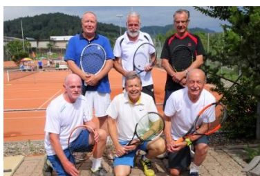
IC-Team Herren 65+ NLA

Zu diesem traditionellen Saisonabschluss sind alle herzlich eingeladen und natürlich sind auch Angehörige, Freunde oder Bekannte zum gemütlichen Beisammensein willkommen.